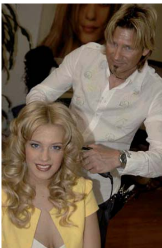
Sarah Jessica Parker